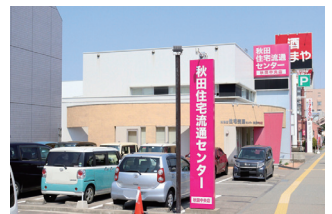
秋田中央店 ▶ 改装工事中